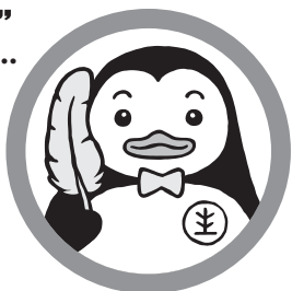
更生ペンギンのホゴちゃん

犯罪や非行の防止と罪を犯した人たちの更生について理解を深め、それぞれの立場においてチカラを合わせ、犯罪や非行のない安全で安心な地域社会を築こうとする法務省主唱の全国的な運動です。